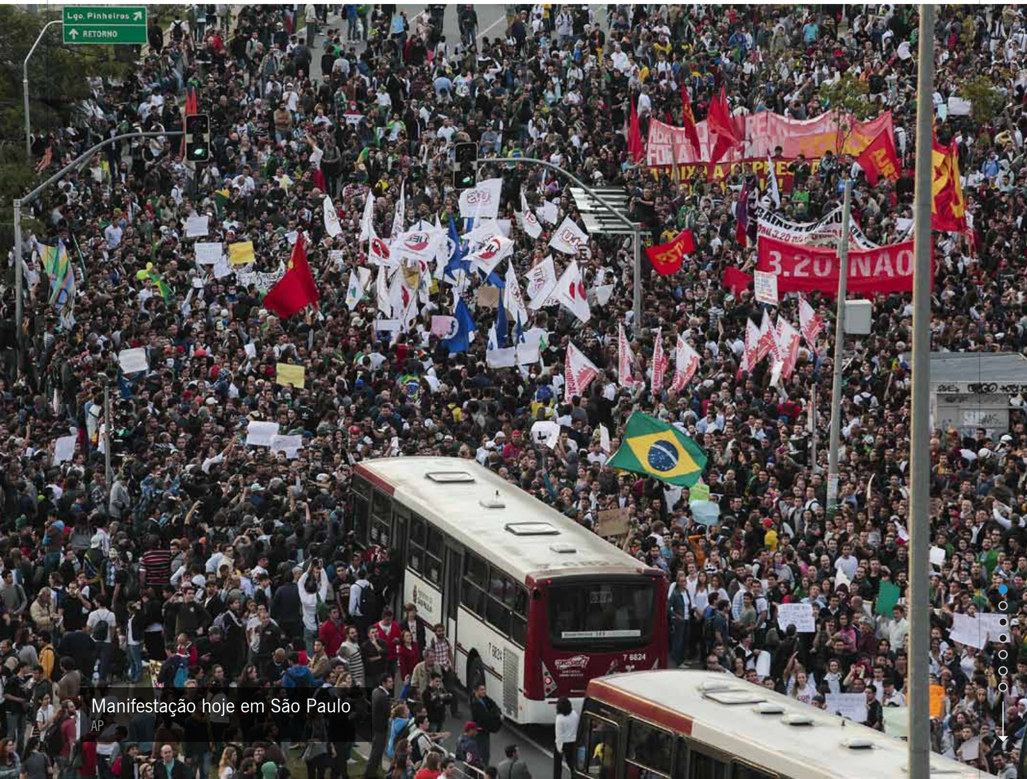
Manifestação hoje em São Paulo